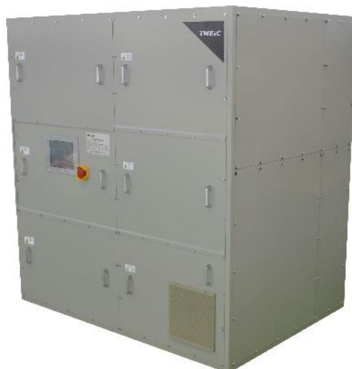
自励式整流器外観写真

URL: https://www.tmeic.co.jp/news_event/pressrelease/2022/20220310.pdf