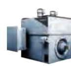
超高速大容量モータ