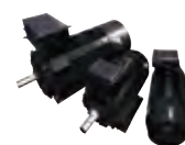
トッランナーモータ